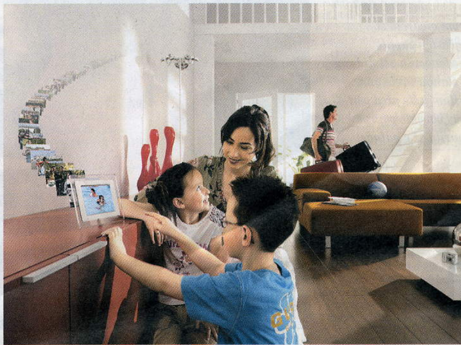
Klasické fotorámečky se v digitálním bytě mění v obrazovky, na nichž si můžete prohlížet snímky přímo z paměťové karty fotoaparátu.

Konkurenční Apple uvedl na trh podobný systém. Apple TV nabízí možnost přehrávat veškerý obsah z databáze filmů, hudby a televizních pořadů na televizní obrazovce. »Apple TV je jako DVD přehrávač jedenadvacátého století. Na rozdíl od domácího kina umí přehrávat veškerý obsah stažený z internetu, ne